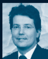
Stefan Bergsmann Horváth & Partners