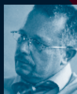
Sven Schnägelberger Kompetenzzentrum für Geschäftsprozess- management